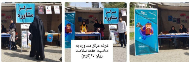
غرفه مرکز مشاوره به مناسبت هفته سلامت روان ۱۷ (کرج)