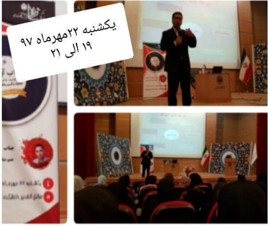
یکشنبه ۲۲ مهرماه ۹۷ ۲۱ الی ۲۱