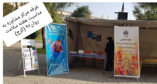
غرفه مرکز مشاوره به مناسبت هفته سلامت روان ۱۷ (کرج)