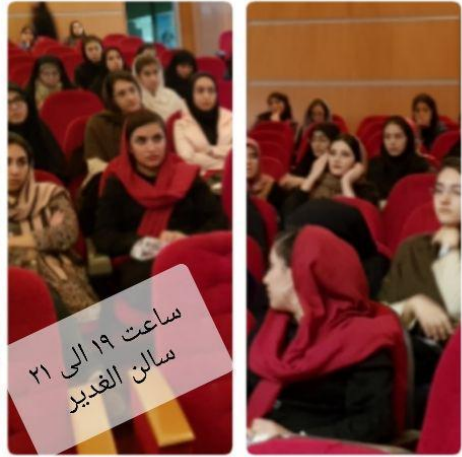
ساعت ۱۹ الی ۲۱ سالن الغدير