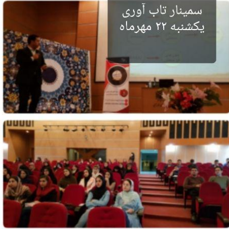
سمینار تاب آوری یکشنبه ۲۲ مهرماه